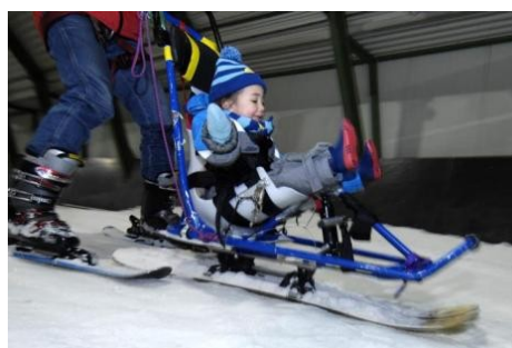
Dolle pret in de afdaling!

Met behulp van sponsors, donateurs en een club van 100 hoopt de stichting elk jaar activiteiten te kunnen financieren en organiseren voor kinderen met een beperking. Het Raakt U maakte meteen een goede start want het won afgelopen najaar ruim drieduizend euro uit het wensenfonds van Rabobank Het Markiezaat. Dat geld is gebruikt om de kinderen een onvergetelijke dag te bezorgen in het Skidôme in Rucphen. Praten kunnen de meeste deelnemende kinderen niet.