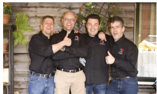
Het bestuur: v.l.n.r.