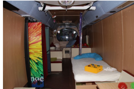
De Snoezelbus van binnen