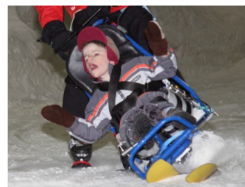
Bas op topsnelheid

voor de kinderen. Broertjes en zusjes van de gehandicapte kinderen zijn er ook bij. Lees snel verder op pagina 3