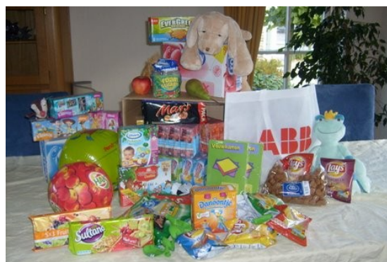
De gesponsorde tasjes met inhoud

We hopen dat we in de komende periode weer een beroep op u mogen doen om de kinderen te kunnen blijven trakteren op geweldige evenementen!